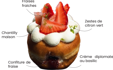
LE FRAISE BASILIC